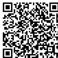
入会申込用フォーム

一般社団法人JET経営研究所 〒160-0011 東京都新宿区若葉1-10-32 電子メール: jet@zenkyou.com 公式サイト: http://jaef.la.coccan.jp/jet/